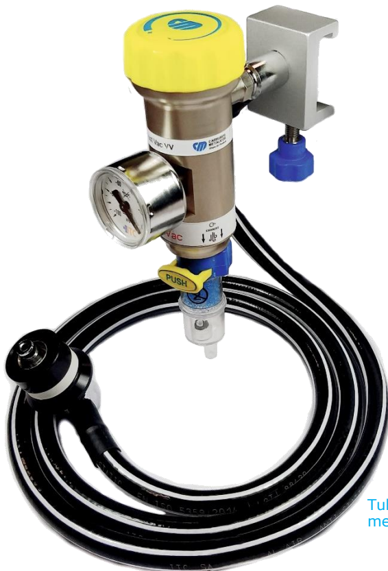
Códigos de modelos com conexão a rail através de uma corredeira.