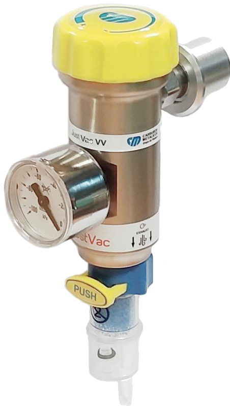
Códigos de modelos com conexão direta